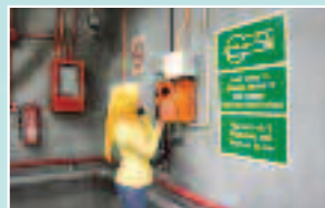
Telefon kecemasan S.O.S di kawasan selamat.