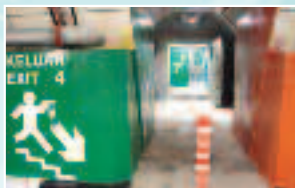
Laluan masuk ke pintu kecemasan