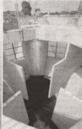
Pembinaan Terowong SMART

PUSAT bandar raya terletak di atas keadaan muka bumi yang berbatu kapur dan mempunyai para air bawah tanah yang tinggi. Berdasarkan keadaan tanah ini, sejenis Mesin Penggerak Terowong jenis Slurry Shield Tunnel Boring Machine (TBM) dipilih. Mesin ini direkabentuk untuk mengatasi masalah penurunan air bawah tanah yang merupakan punca utama kejadian pemendapan. Berdasarkan fakta panjang penutup mesin TBM itu ialah 10.2 meter, berat 1,500 tan; panjang keseluruhan 70 meter, berat keseluruhan 2,500 tan; diameter kepala pemotong 13.3 meter, kelajuan maksima 30mm perminit dan ukurlilit stereng minimum ialah 200meter.